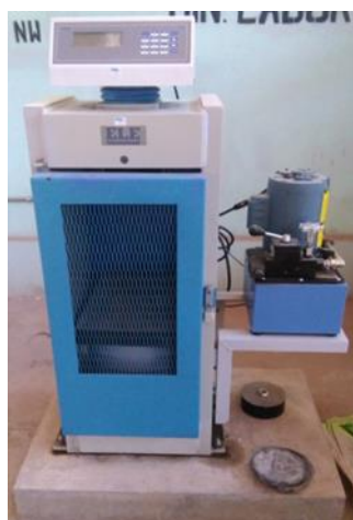
Prensa de concreto