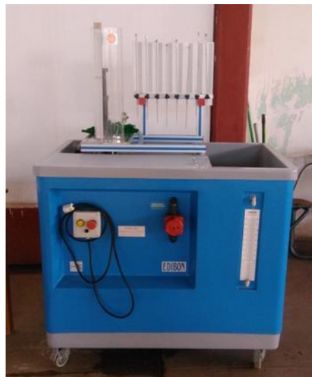
Banco hidráulico FME 00